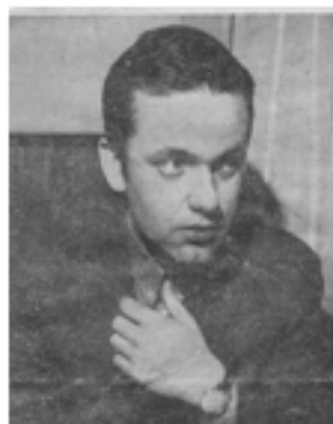
Jørn Juhl 1970