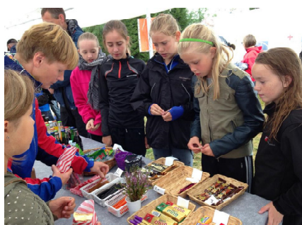
Godt besøgt kiosk