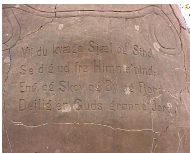
Ord på "Pinden"

Omkring 1920 var Trædballehus en af landets