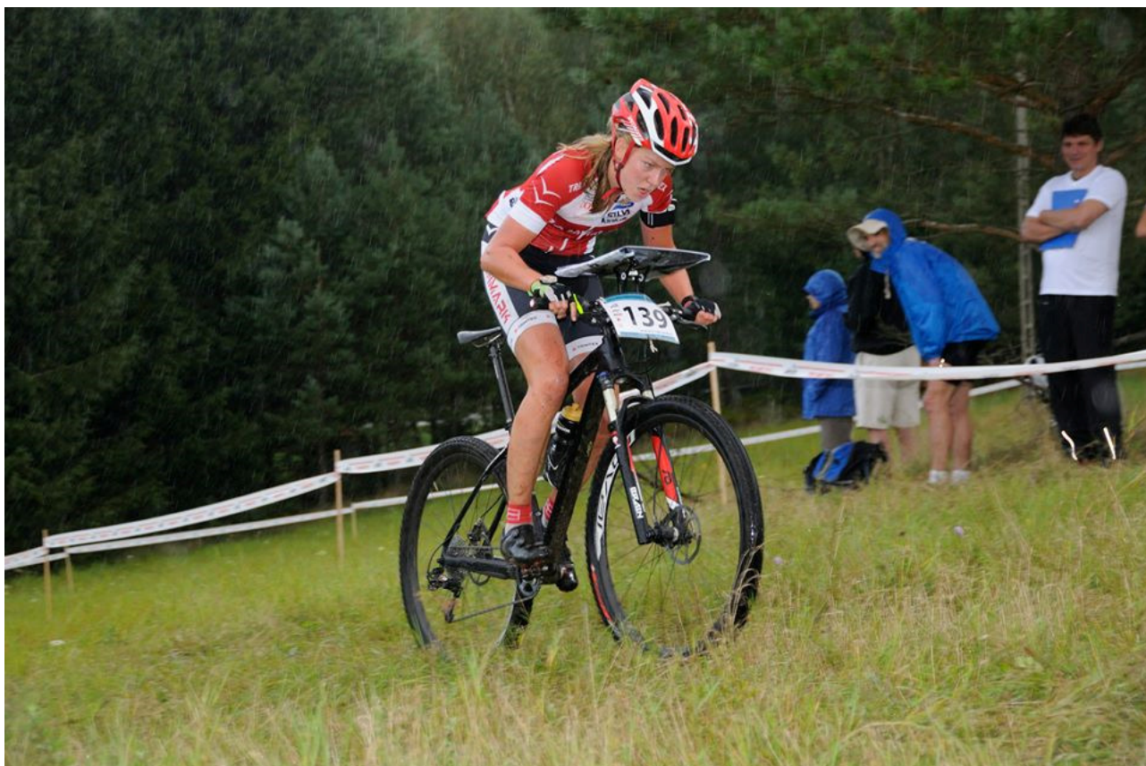
På vej i mål til bronze