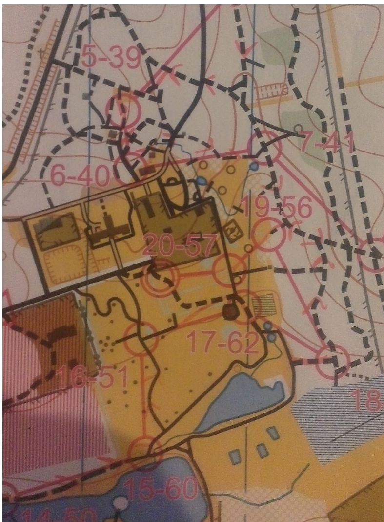
Kortudsnit sprint mix-stafet

Sprint mix-stafetten er ny i VM-sammenhæng, og var derfor ikke officiel. Alle var dog til start alligevel, og der var således et hårdt felt. Pigen på holdet kører 1. og 3. tur, mens drengen kører 2. og 4. tur. Hver tur er mellem 10 og 20 min. og med 20 poster på 6,5 km og hastigheder op mod 35 km/t gælder det om hele tiden at have overblikket og være med på kortet.