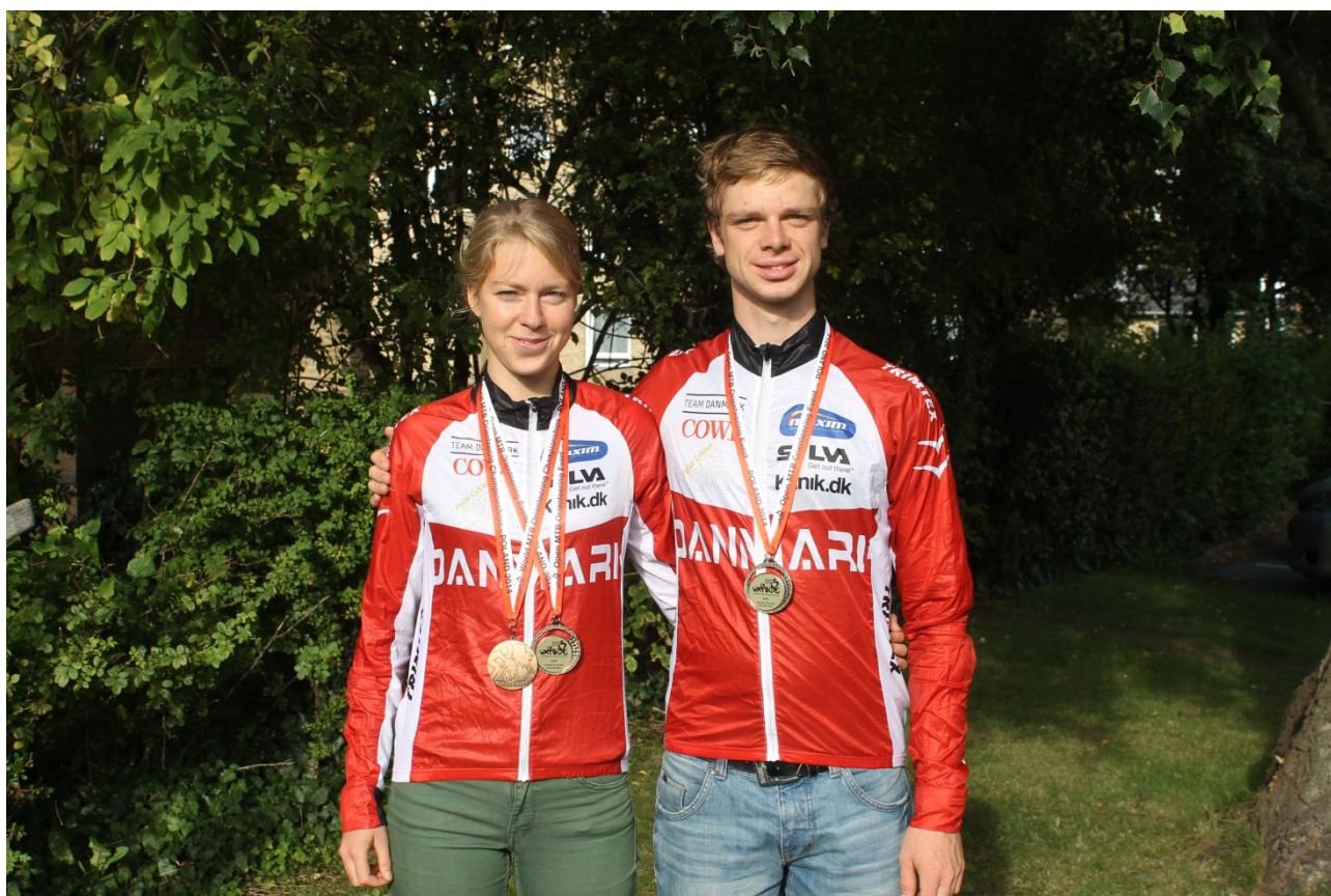
VM medaljer!!

Stafetten var afslutningen på det sportslige til VM. Tilbage var der kun den legendariske VM-fest, hvor alle er kammerater og hygger sig efter en hård sæson.