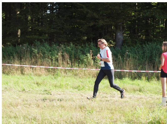
Elin på vej i mål: Foto: Karl Ditlevsen

Efter post 4 over en dyb grøft + en sti, og så fandt jeg en klippet/slået sti og løb videre udenom for at finde post 5. Rodede lidt for at finde den ved en sten ved en vækstgrænse. Lige på til post 6, udenom til 7, herefter mit længste udenomsvejvalg til post 8. Post 9 i en mose, lidt forsigtigt videre ud til en stor sti, fart på til 10'eren, som var en lille slugt, hvor jeg var ved at skvatte på et gammelt rustent bliktag. Måske har der en gang været et fodersted til dyrene her.