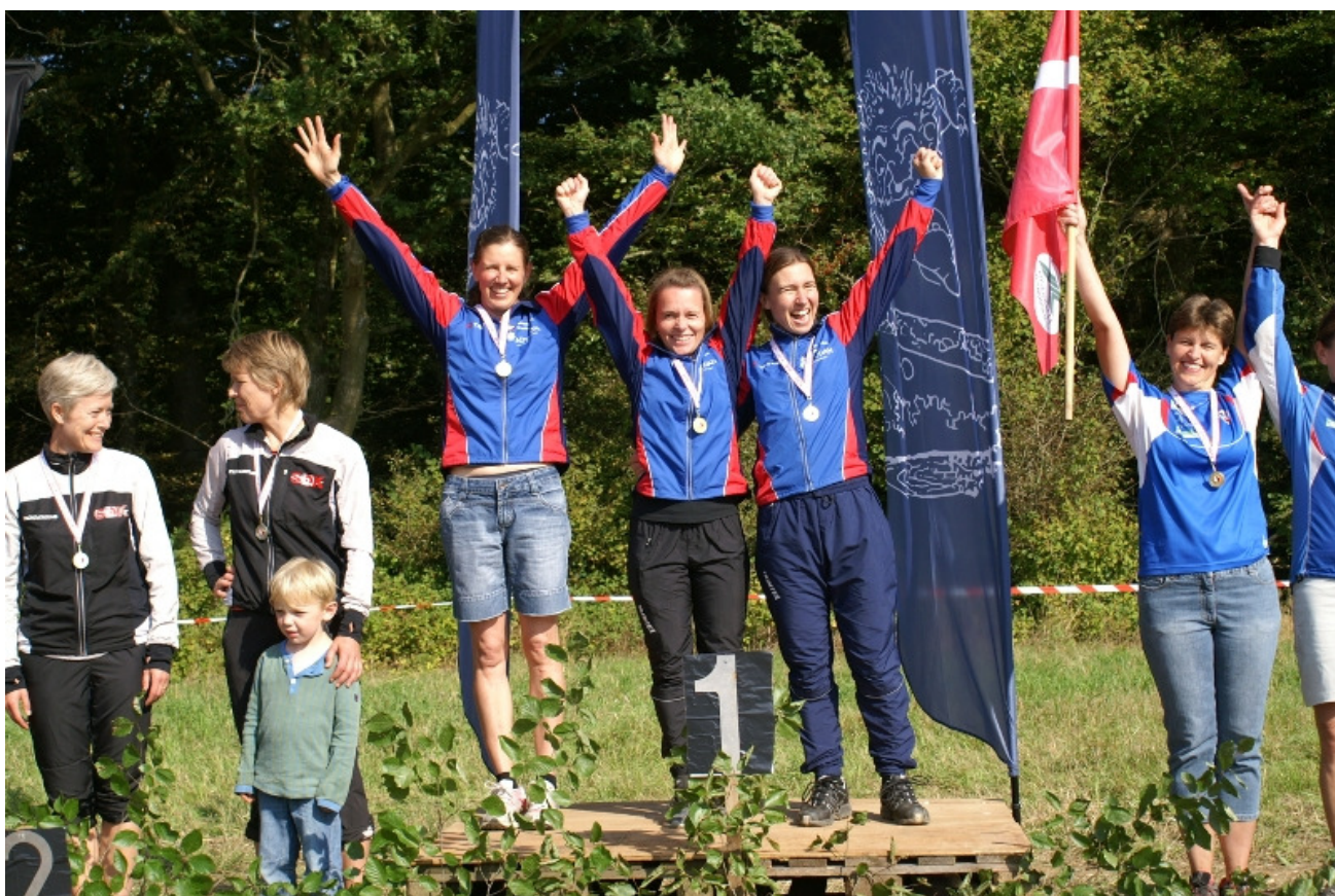
Efter 2:28:32 er hele D40-holdet samlet på GULD -pladsen hele 6:59 foran Silkeborg OK

Tak til Kolding OK for en fint arrangeret stafet på en dejlig solskinsdag.