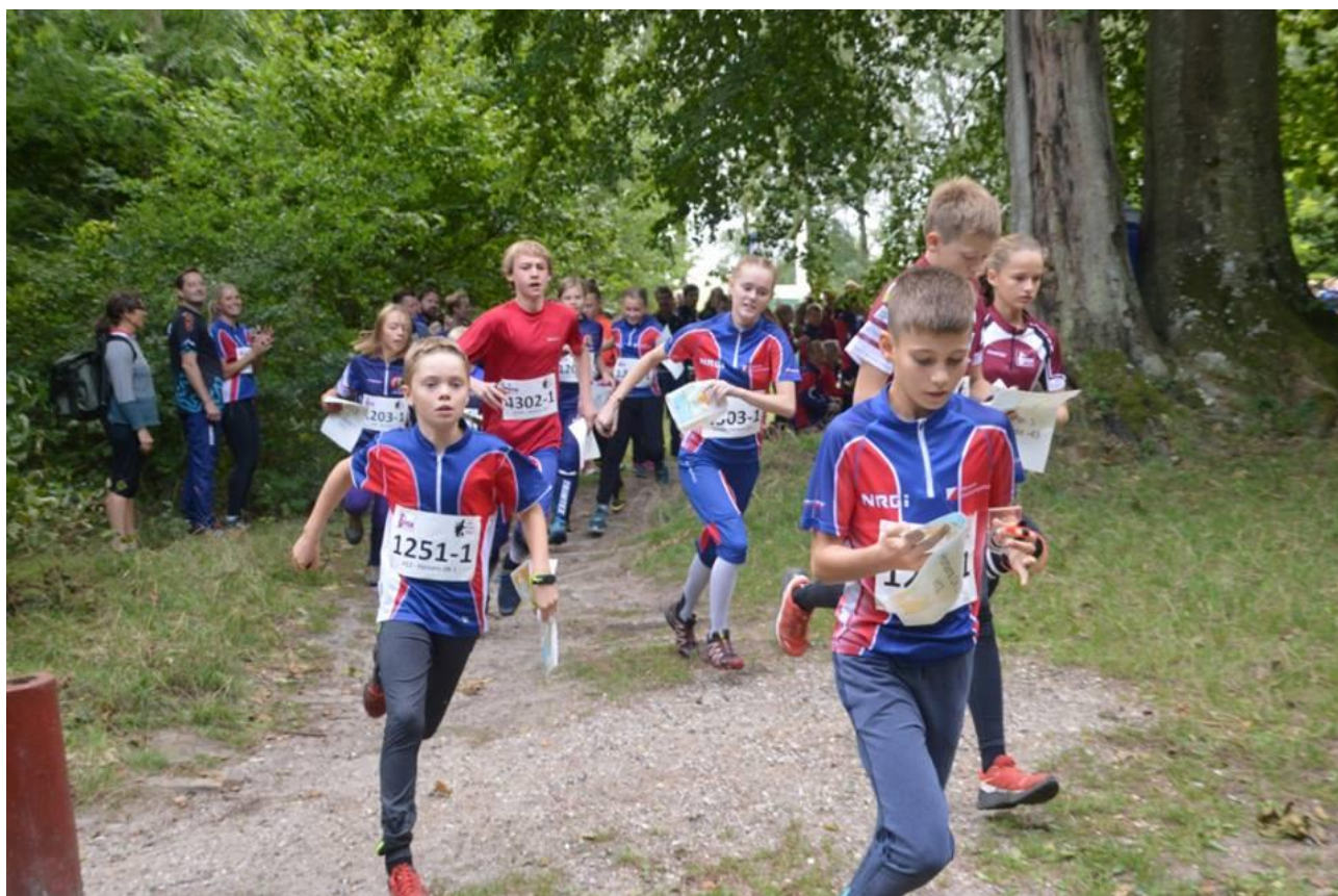
Starten til JFM stafet, 18. august i Fløjstrup.

Horsens OK og ungdomsafdelingen er afhængig af at tiltrække nye frivillige for at gøre ungdomsarbejdet endnu bedre. Vi har mange ideer, men der er også plads til dine! – og du behøver ikke at sidde i ungdomsudvalget for at bidrage med ideer eller indsats. Det kan være som hjælpetræner, turarrangør eller noget helt andet. Hvis du syntes du mangler noget for at lige præcis dit barn kan udvikles som orienteringsløber, hører vi gerne om det.