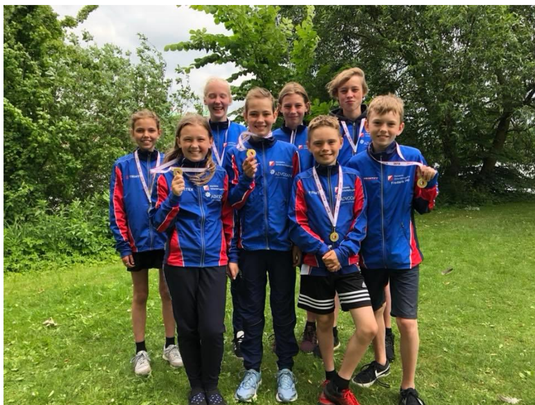
Medaljevinderne fra DM Mix sprint stafet 27. maj i Hillerød,