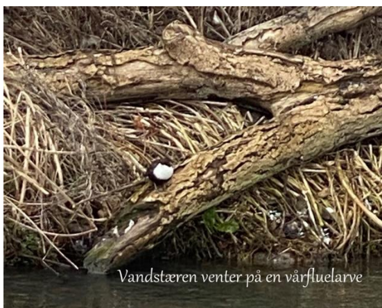
Vandstæren venter på en vårfluelarve

Første gang, vi var sammen, var torsdag den 20. januar, hvor vi fik et tilbageblik på året 2021 igennem alle de billeder, der var blevet taget i løbet af året. En tradition, som vi har haft i mange år, og som naturligt giver os gensynsglæde med de mange fine oplevelser, vi haft i årets løb.